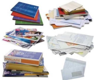
→ Papier, livres souples, prospectus, enveloppes...