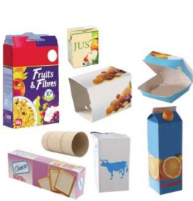
→ Briques et cartonnettes