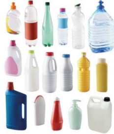
→ Bouteilles, bidons, flacons en plastique ATTENTION : Pas de bidons ayant contenus des produits dangereux