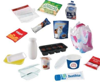
→ Sachets, barquettes, tubes...