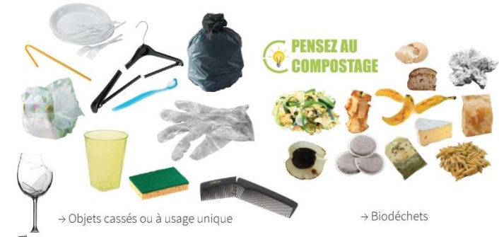
→ Objets cassés ou à usage unique