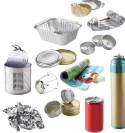
→ Petits et gros emballages métalliques